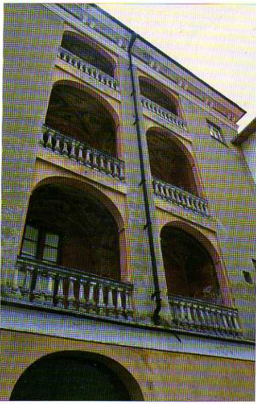
TAV. XXII - Il loggiato di Palazzo Scorza, casa natale del pittore Sinibaldo.