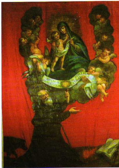
TAV. XIX - Oratorio di S. Antonio Abate. Stendardo processionale (seconda metà del XVII secolo).