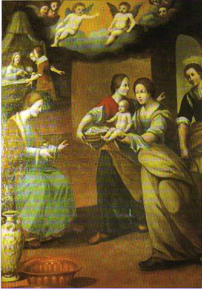
TAV. XVII - Oratorio del Gonfalone. Natività della Vergine (Bernardo Carosio, 1631).