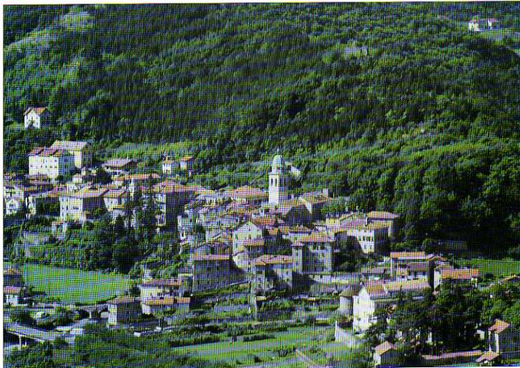
TAV. XXV - Il compatto nucleo centrale del Borgo, sul contrafforte che segna la confluenza del Morzone nel Lemme.