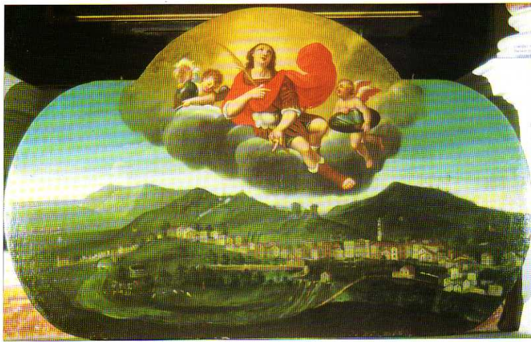
TAV. XVI - Oratorio del Gonfalone. Traslazione delle reliquie di S. Clemente Martire (Bartolomeo Agosti, 1682).