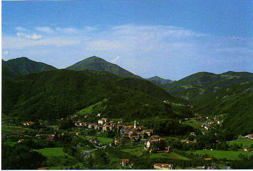
TAV. XXIV - Voltaggio da Nord-Est. Sullo sfondo svetta la mole del Monte Tobbio.