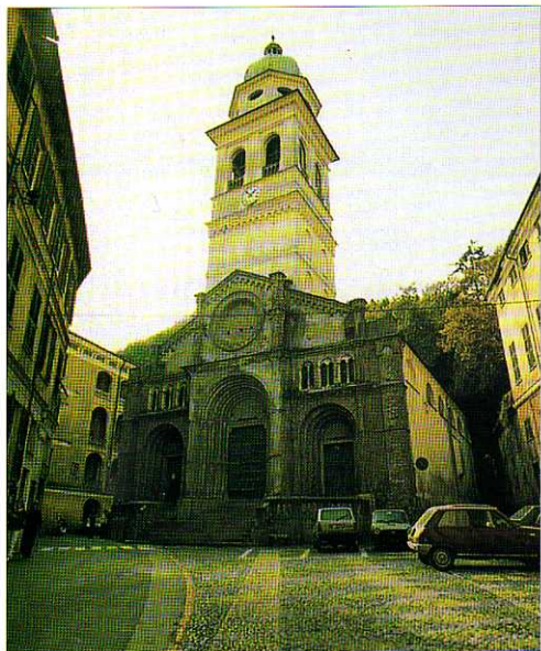
TAV. II - Chiesa Parrocchiale di S.M. Assunta e dei SS. Nazario e Celso. Le prime testimonianze d' archivio relative all' istituzione risalgono al XIII secolo.