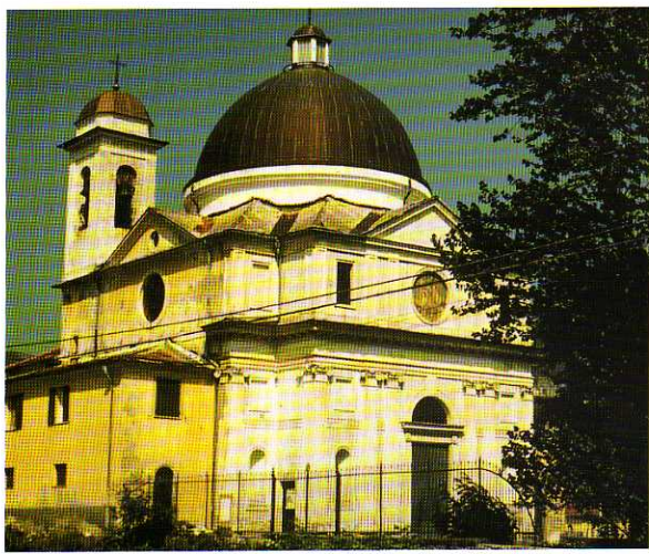
TAV. VIII - Oratorio di S. Giovanni Battista (1878).