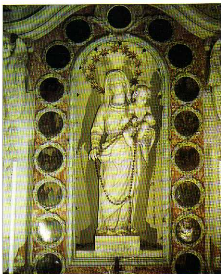
TAV. III - Chiesa Parrocchiale. Altare del Rosario. Statua marmorea della Madonna del Rosario (monogrammista T.C. e lapicidi Gio Batta e Antonio Gallo e Gaetano Solari, 1647).