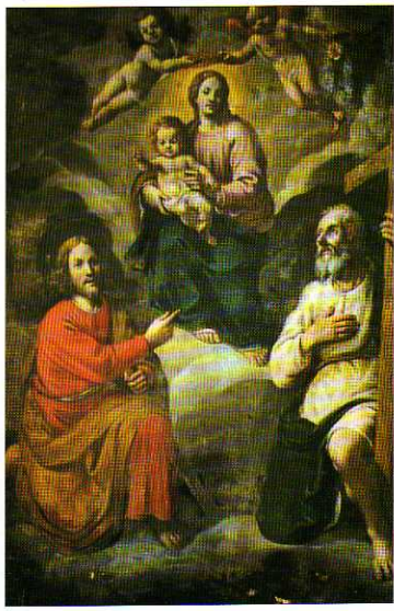
TAV. VI - Chiesa Parrocchiale. Vergine con Bimbo e i Santi Antonio e Rocco (Giuseppe Badaracco, 1628).