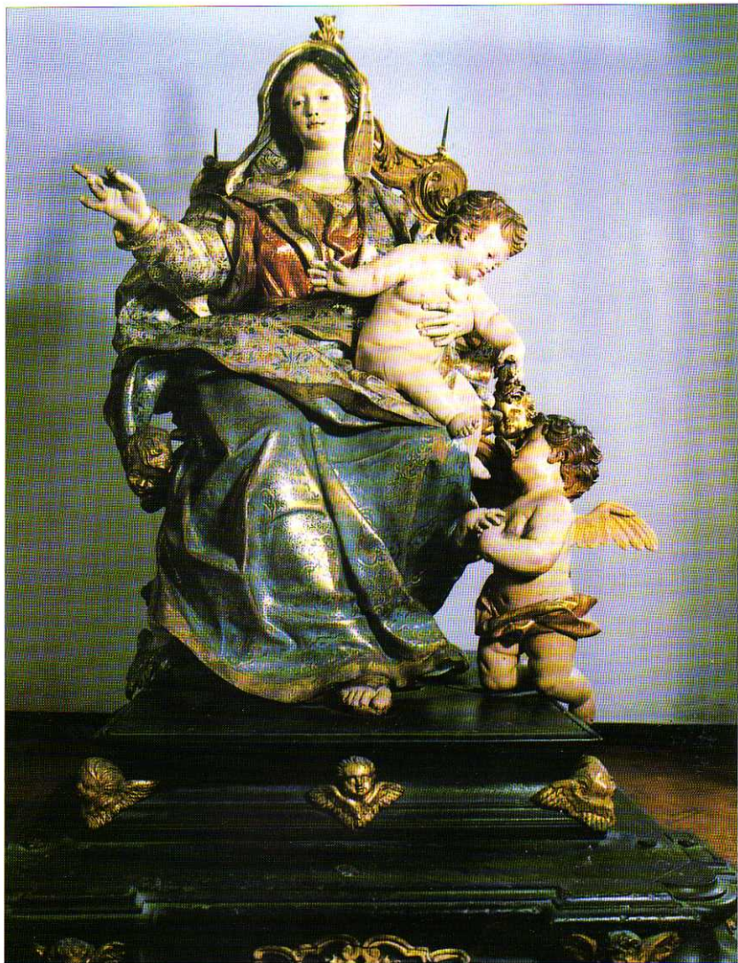
TAV. IV - Chiesa Parrocchiale. Vergine col Bambino (scultura lignea policroma di Antonio Maria Maraglino, 1716).