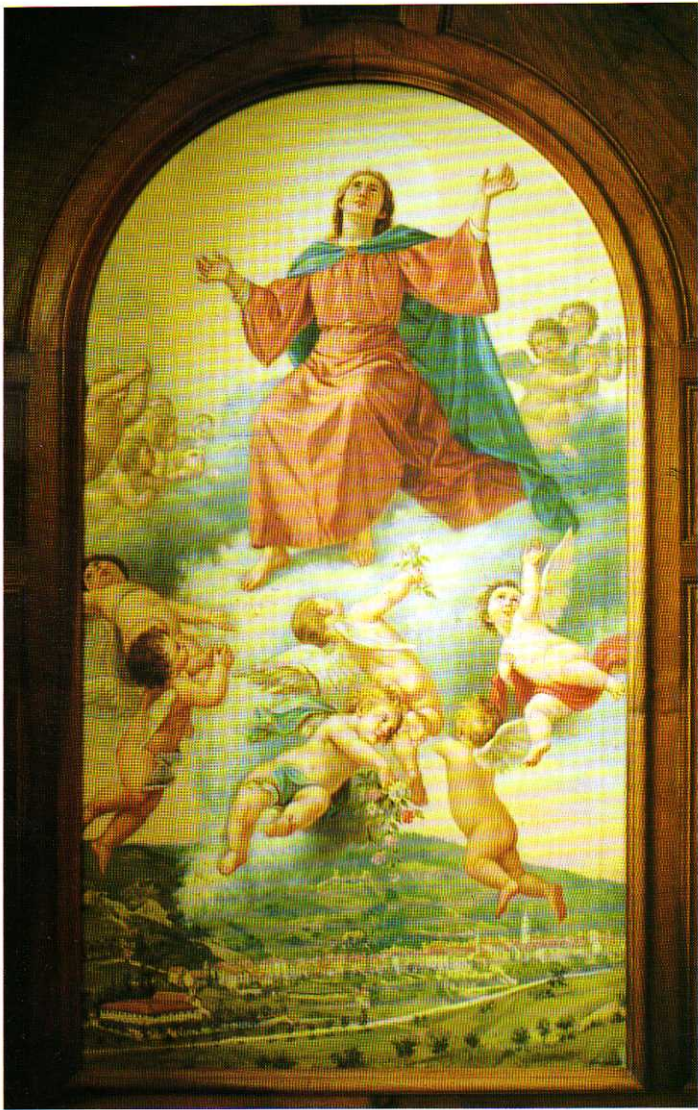
TAV. VII - Chiesa Parrocchiale. Assunta (Oldoino Multedo, fine del XIX Secolo).